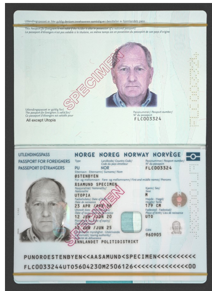
Optimal opsætning med elastikker ved fotooptag

OBS: Undgå Screenshot eller Print Screen.